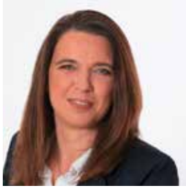
Bundesrätin Sandra Böhmwalder