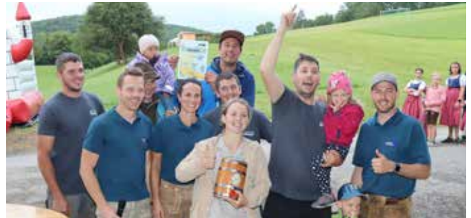
2. Platz Leit'n Schafft