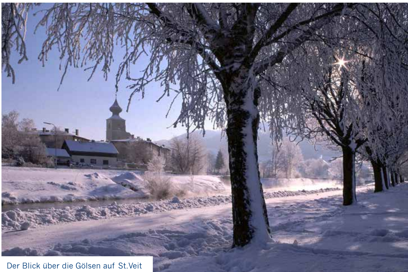
Der Blick über die Gölsen auf St.Veit