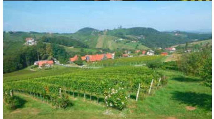
Seniorenbund Ausflug in die Südsteiermark