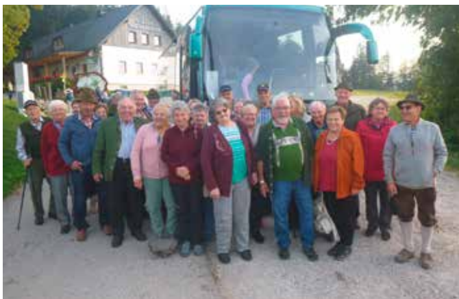
Wanderausflug Hochbärneck, St.Anton an der Jessnitz